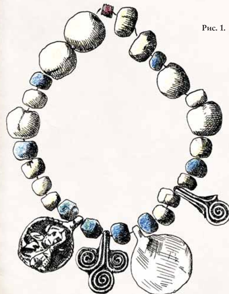
Рис. 1. Иконка-привеска в составе ожерелья из женского погребения середины XII в. в кургане близ с. Никольское (Московская область)

В археологической и искусствоведческой литературе иконками-привесками принято называть особую категорию миниатюрных произведений металлопластики с христианскими изображениями. Судя по малым размерам (10–30 мм в ширину), они, по-видимому, были предназначены для ношения не поверх одежды, как литые иконки более крупных форм, а под одеждой, на одном шнуре с нательным крестом или даже вместо него. Изображения на иконках-привесках чаще всего находятся лишь на одной, лицевой, стороне, хотя встречаются и двухсторонние экземпляры. Все иконки отлиты из различных медных и оловянисто-свинцовых сплавов и всегда имеют оглавие с отверстием для шнура. В ранний период своего бытования на территории Древней Руси они нередко включались в состав женских ожерелий вместе с разнообразными бусами и привесками, несущими языческую символику (Беленькая Д.А., 1976, с. 88–98; Мусин А.Е., 202, рис. 114). Одним из ярких примеров является ожерелье из женского погребения середины XII в. в курганном могильнике Никольское в Подмосковье (Станюкович А.К., 1985, с. 86–87, рис. 1), где иконка-привеска с изображением Господа Вседержителя входила в состав ожерелья из 25 стеклянных бус и соседствовала с гладкой монетовидной и двумя трезновидными привесками (рис. 1).