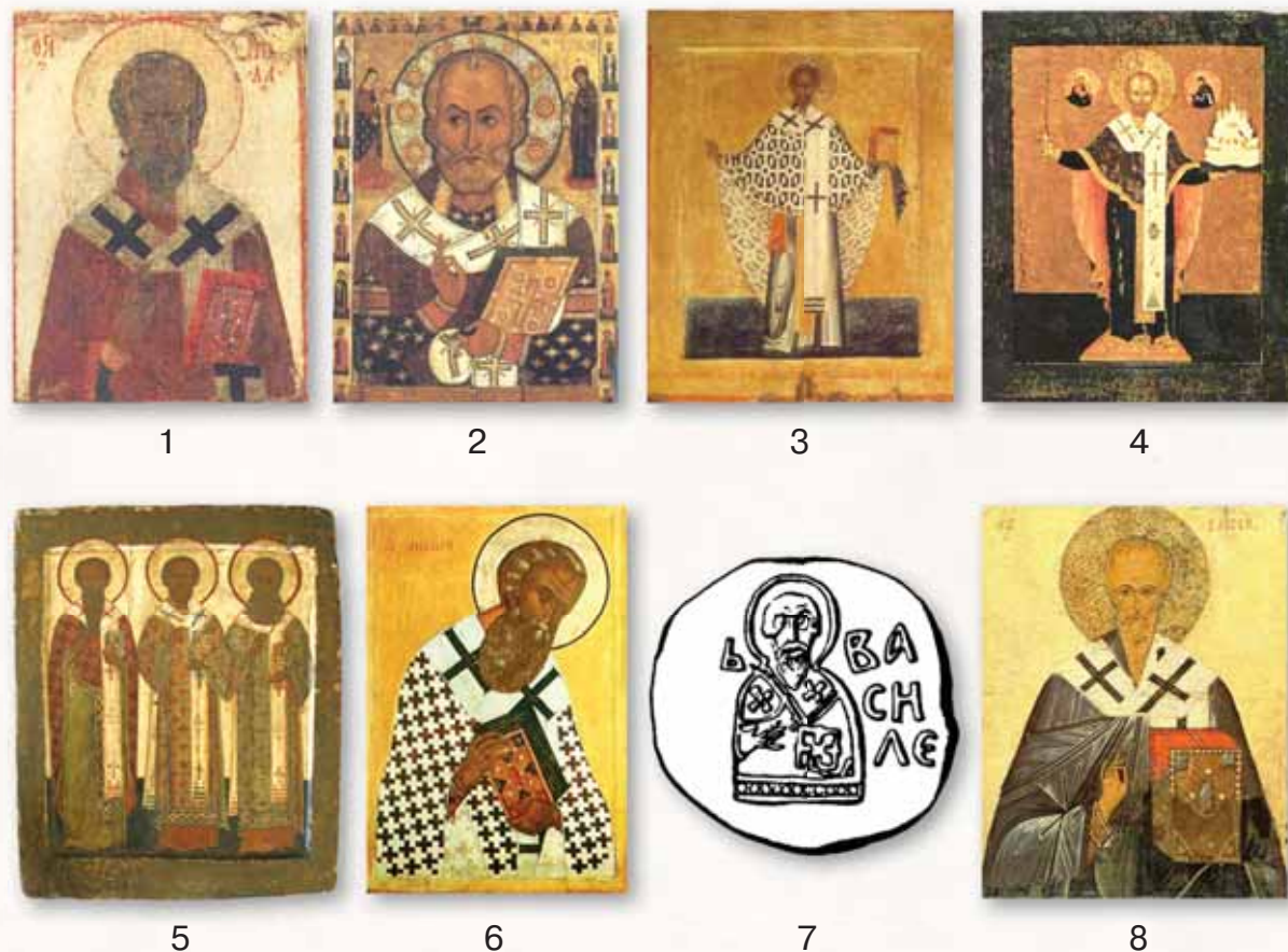
Рис. 8. Иконография святителей. 1 — Николай Чудотворец. Икона XII в.; 2 — Никола Липный. Новгородская икона 1294 г. с изображением Никейского чуда; 3 — Никола Зарайский. Новгородская икона 1531 г.; 4 — Никола Можайский. Палехская икона XVII в.; 5 — Три святителя (Василий Великий, Григорий Богослов и Иоанн Златоуст). Московская икона XVI в.; 6 — святитель Афанасий Александрийский. Икона XV в.; 7 — святитель Василий Великий. Изображение на актовой печати Великого князя Московского Василия Дмитриевича (по В.А. Янину и П.Г. Гайдукову); 8 — Священномученик Власий. Икона XV в.

Иконки-привески группы V, включенные в Каталог, относятся к периоду от XII–XIII вв. до XV–XVI вв. и имеют круглую (тип 1), овальную (тип 2), прямоугольную (тип 3), киотчатую (тип 4), арочную (тип 5), крестовидную (тип 6) и листовидную (тип 8) формы. Если не считать двух экземпляров домонгольского времени, происходящих с территории современной Украины (табл. XII, 171, 172), большинство известных мест находок расположено в пределах Северо-Восточной Руси (Ленинградская, Московская, Рязанская, Тверская и Тульская области). Один экземпляр, датируемый первой третью XIV в. (табл. XII, 186), происходит с территории Саратовской области — исторической территории Золотой Орды.