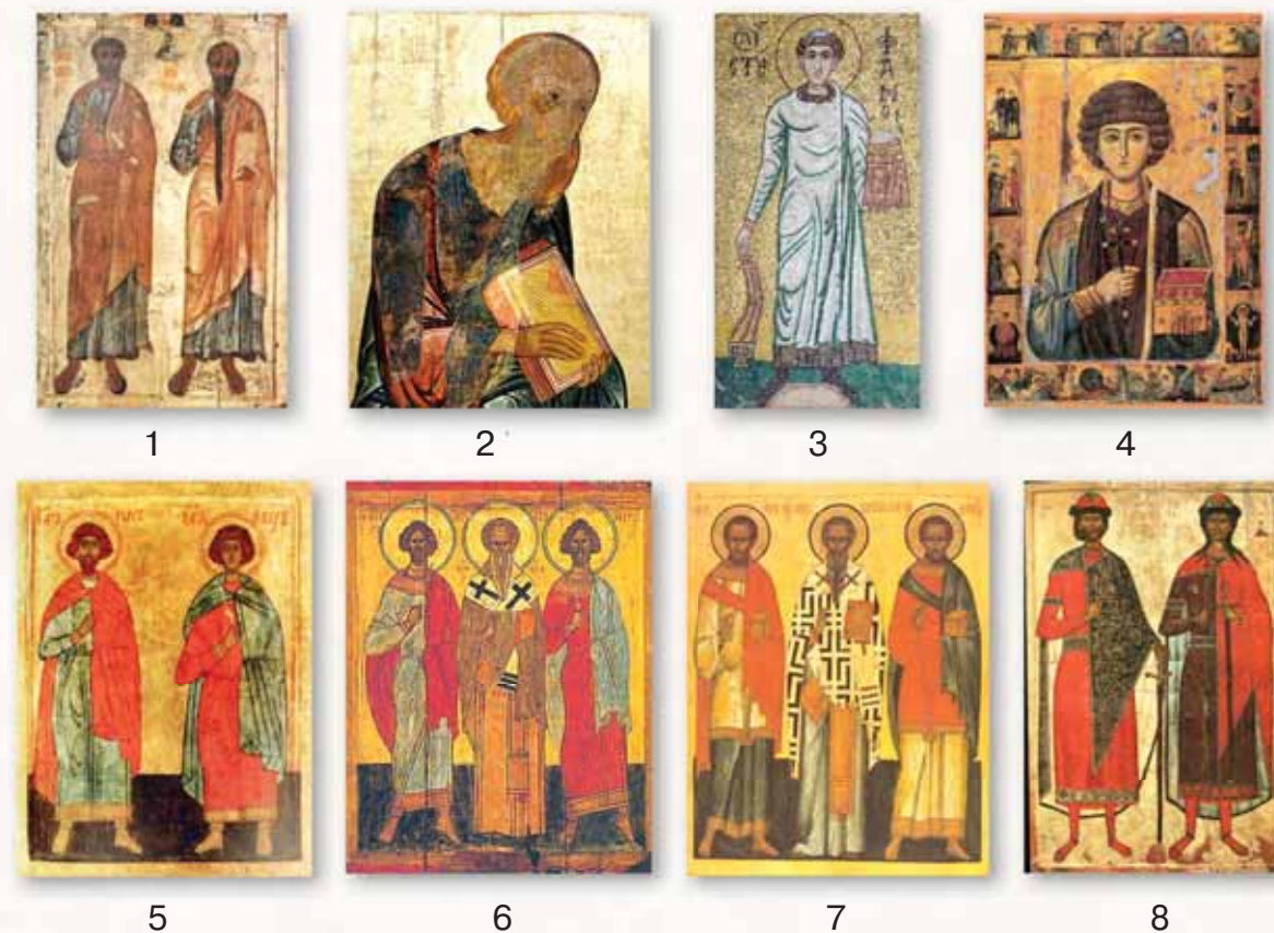
Рис. 9. Иконография избранных святых. 1 — Апостолы Петр и Павел. Икона XII в.; 2 — Апостол Иоанн Богослов. Деталь иконы из деисусного чина в Успенском соборе во Владимире (Андрей Рублев и Даниил Черный, 1408 г.); 3 — Первомученик архидиакон Стефан. Мозаика собора Михайловского монастыря в Киеве. Начало XII в.; 4 — Великомученик и целитель Пантелеймон. Византийская икона начала XIII в.; 5 — Мученики Флор и Лавр. Икона XV в.; 6 — Мученики Флор и Лавр и апостол Иаков, брат Господень по плоти (в центре). Новгородская икона XV в.; 7 — Святые бессребреники и целители Косма и Дамиан и апостол Иаков, брат Господень по плоти (в центре). Новгородская икона XV в.; 8 — Святые благоверные князья-страстотерпцы Борис и Глеб. Псковская икона XIV в.

Святые пророки. К ним относятся святые, получившие от Бога дар прозрения будущего; по внушению Святого Духа они предсказывали о грядущем Спасителе. Наиболее почитаемыми в средневековой Руси были пророки Илия и Иоанн Предтеча. В иконографии пророков обязательно присутствует изображение нимба как символа святости и особого избранничества Божия. Пророки одеты в хитон (нижнюю одежду в виде рубахи до пят) и гиматий. Последним из ветхозаветных пророков был Иоанн Предтеча (Креститель), которого иногда изображают не в хитоне и гиматии, а в одежде из верблюжьего волоса (власянице).