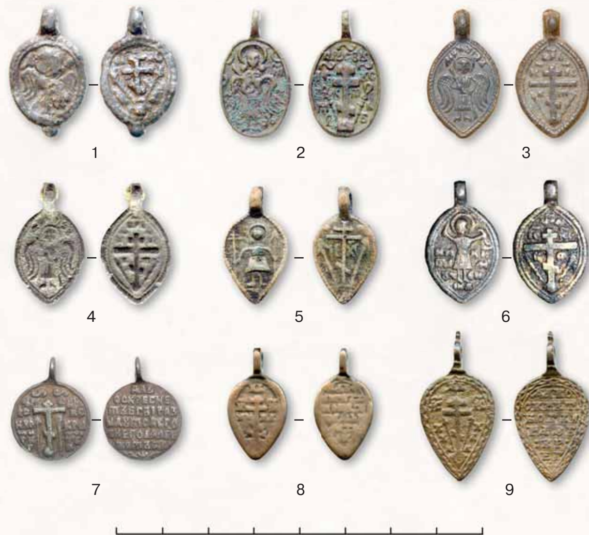
Рис. 16. Иконки-привески второй половины XVII — XIX вв. 1–4 — архангел Михаил; 5 — святой воин-мученик; 6 — Никита с бесом; 7–9 — Голгофский Крест (по материалам частных коллекций и сети Интернет)

«Домострой» (середина XVI в.) прямо запрещал православным христианам употреблять в повседневной жизни какие-либо амулеты природного характера (громовые стрелы, волшебные камни и кости и др.). С точки зрения догматического богословия и канонического права ношение амулетов-оберегов с христианскими ликами является не меньшим грехом, так как смешение священных и нечестивых понятий ведет к профанации святыни и кощунству (Николаева Т.В., Чернецов А.В., 1991, с. 3, 6). По-видимому, именно активизацией в первой половине — середине XVI в. церковно-государственной борьбы