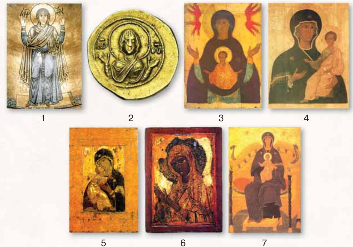
Рис. 5. Иконография Богоматери. 1 – Богоматерь Оранта Влахернитисса. Мозаика XI в. в абсиде Софийского собора в Киеве; 2 – Изображение Богоматери Оранты на тетартероне византийского императора Константина X Дуки (1059–1067); 3 – Богоматерь Знамение. Икона XV в.; 4 – Богоматерь Одигитрия Смоленская. Икона 16 в.; 5 – Богоматерь Умиление Владимирская. Икона XII в.; 6 – Богоматерь Агиосоритисса. Икона XIV в.; 7 – Богоматерь на Престоле. Икона XVI в.

Изображения Богоматери на иконках-привесках, составляющих группу II (46 экз.; 13,3% от общего количества), относятся к следующим основным иконографическим подгруппам (рис 2): II.A. С ростовым изображением Богоматери Оранты Влахернитиссы; II.B. С погрудным изображением Богоматери Оранты; II.B. С изображением Богоматери Знамение; II.G. С изображением Богоматери Одигитрии; II.D. С изображением Богоматери Умиление; II.E. С изображением Богоматери Агиосоритиссы; II.Ж. С изображением Богоматери на Престоле.