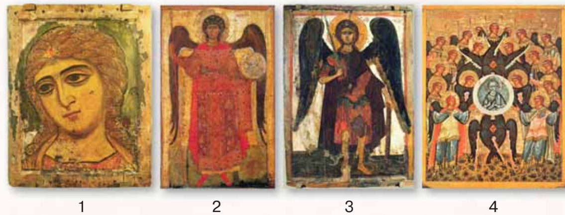
Рис. 6. Иконография Небесных Сил бесплотных. 1 — Икона «Ангел Златые Власы» (Архангел Гавриил). Новгород, XII в.; 2 — Архангел Михаил с мерилем и зеркалом. Новгородская икона XIII в.; 3 — Архистратиг Михаил с мечом и ножнами. Тверская икона XIV в.; 4 — Изображение херувима и серафима на иконе «Собор архангелов». Новгород, XV в.

Архангелы и ангелы изображаются в виде безбородых юношей (рис. 6, 1) с крыльями за спиной и с нимбом вокруг головы (рис. 6, 2), серафимы — в виде человеческих ликов с шестью крыльями, херу-