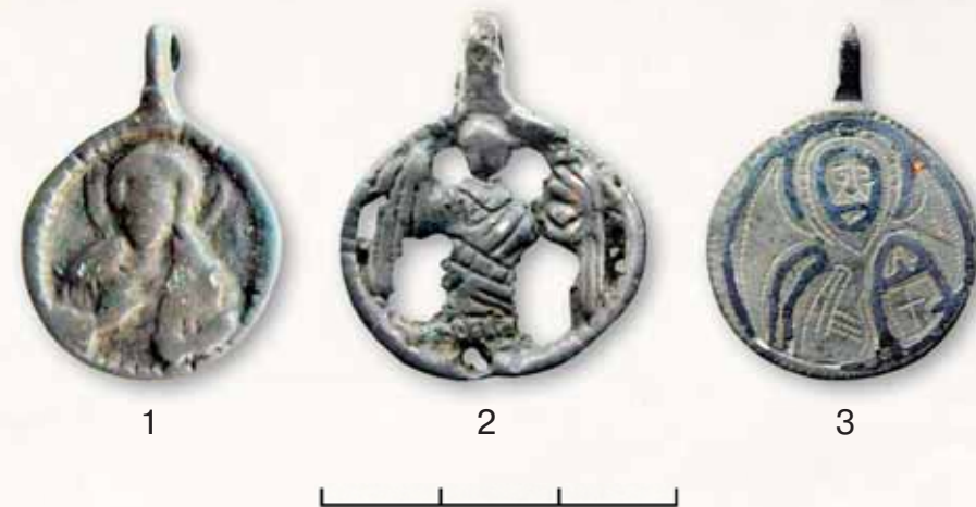
Рис. 2. Подразделение иконок-привесок по технике исполнения изображений. 1 — рельефная; 2 — рельефно-прорезная; 3 — плоская

По технике исполнения изображений (рис. 2) каждая иконографическая группа или подгруппа подразделяется или может подразделяться на две или три части , обозначаемые цифровыми индексами: 1 — рельефные иконки-привески (рис. 2, 1); 2 — рельефно-ажурные иконки-привески (рис. 2, 2); 3 — плоские иконки-привески (рис. 2, 3).