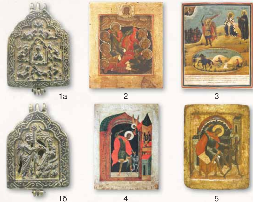
Рис. 11. Иконография апокрифических сюжетов. 1a — Композиция «Господь Вседержитель и Семь спящих отроков Эфесских» на лицевой створке новгородской иконки-энколпия XIV в. (собрание ЦМИАР); 16 — Композиция «Явление архангела Сихаила святому Сисинию» на оборотной створке той же иконки; 2 — Семь спящих отроков Эфесских. Икона XIX в.; 3 — Архангел Сихаил (Михаил) поражает трясовиц, святой Сисиний и святой Маруф. Икона. Центральная Россия. 1831 г.; 4 — Святой Никита, побивающий беса. Московская икона первой половины XVI в.; 5 — Святой Никита, побивающий беса. Московская икона середины XVI в.

Об отроках упоминает в своем «Хождении» в Святую землю русский игумен Даниил (начало XII в.). Особую популярность на Руси этот сюжет приобрел в XIV в. Сюжет встречается в произведениях мелкой пластики, которые, по-видимому, служили оберегами от бессонницы, так как в народе спящие отроки Эфесские почитались как целители животворящим сном. На произведениях мелкой пластики спящие отроки иногда располагаются вокруг образа Спасителя или святителя Николая (рис. 11, 1a). Встречается этот сюжет также в произведениях монументальной живописи (фреска в Успенском соборе Московского Кремля) и иконописи (рис. 11, 2).