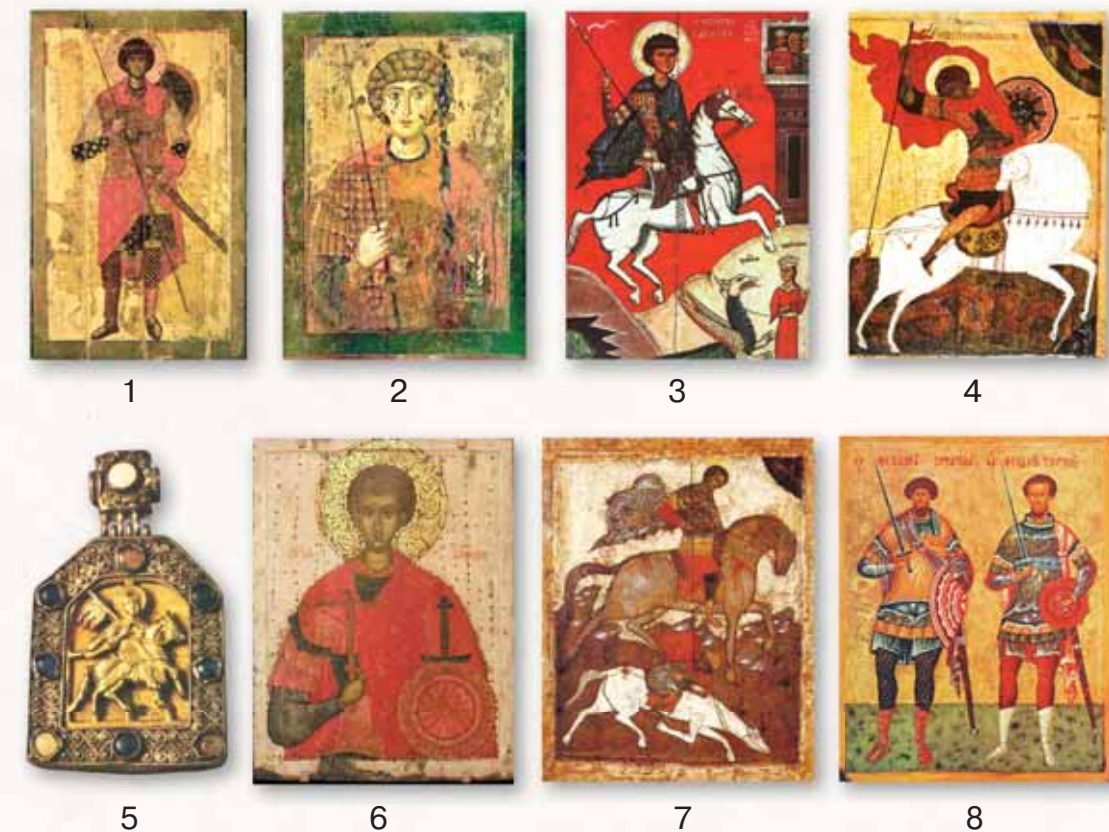
Рис. 7. Иконография святых воинов. 1, 2 — Святой Георгий Победоносец. Иконы XII в.; 3, 4 — Чудо святого Георгия о змие. Новгородские иконы XIV и XV вв.; 5 — Святой Георгий со стягом. Новгородская иконка-энколпий XIV в. (лицевая сторона). Фото Б.А. Кузнецова; 6 — Святой Димитрий Солунский. Псковская икона XV в.; 7 — Чудо святого Димитрия Солунского о нечестивом царе (святой Димитрий поражает царя Калояна). Московская икона XVI в.; 8 — Святые Феодор Стратилат и Феодор Тирон. Новгородская икона XV в.

Со времен Дмитрия Донского святой Георгий признан небесным покровителем Москвы. В описании Куликовской битвы святой Георгий наравне с другими представителями сил «небесного воинства» — ангелами, полками святых мучеников, святым воином Димитрием, русскими князьями Борисом