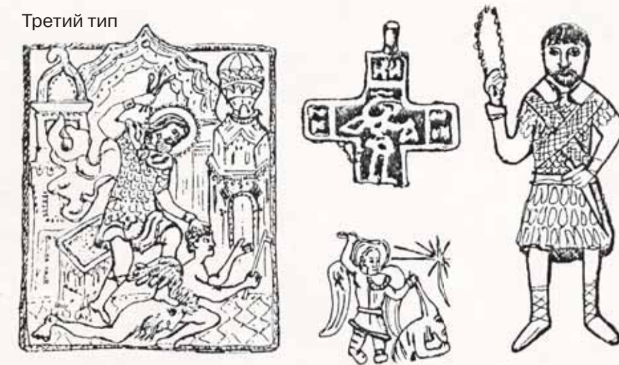
Рис. 12. Иконографические варианты (типы) композиций с Никитой Бесогоном (по В.В. Хухареву)

распространение этот сюжет имел в XIV–XVII вв., когда композиция с Никитой и бесом стала во множестве воспроизводиться на каменных и меднолитых иконках, крестах-энколпионах, наперсных и нагрудных крестах и амулетах-змеевиках. Краткий обзор вещественных источников и их осмысление можно найти в ряде специальных работ (Векслер А.Г., Беркович В.А., 2005; Добрыкин Н.Г., 1900; Ткаченко В.А., Хухарев В.В., 1999, с. 68–79; Хухарев В.В., 1994, с. 210–215; Четыркин И.Д., 1898; 1900).