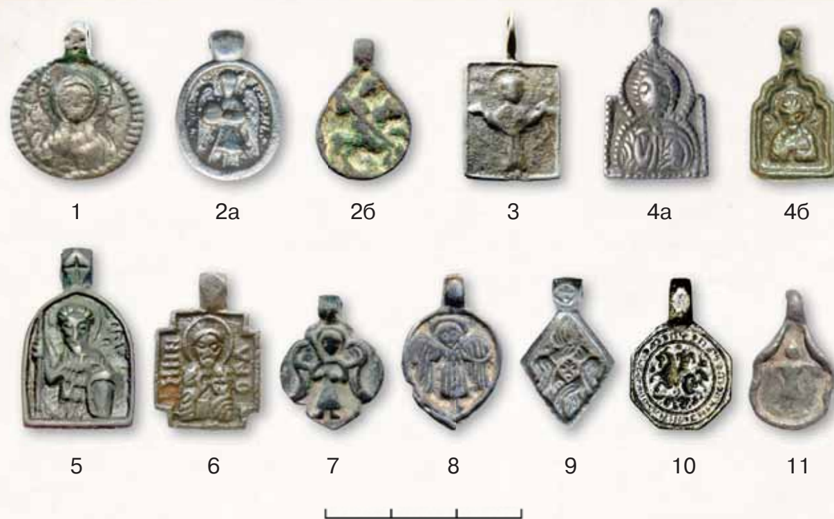
Рис. 3. Формы иконок-привесок. 1 — круглая; 2а, б — овальная и овально-грушевидная; 3 — прямоугольная; 4а, б — киотчатая и фигурно-киотчатая; 5 — арочная; 6 — крестовидная; 7 — квадрифолийная; 8 — листовидная; 9 — ромбовидная; 10 — многогранная; 11 — индивидуальная

Иконография иконок-привесок будет рассмотрена и объяснена в следующем разделе книги.