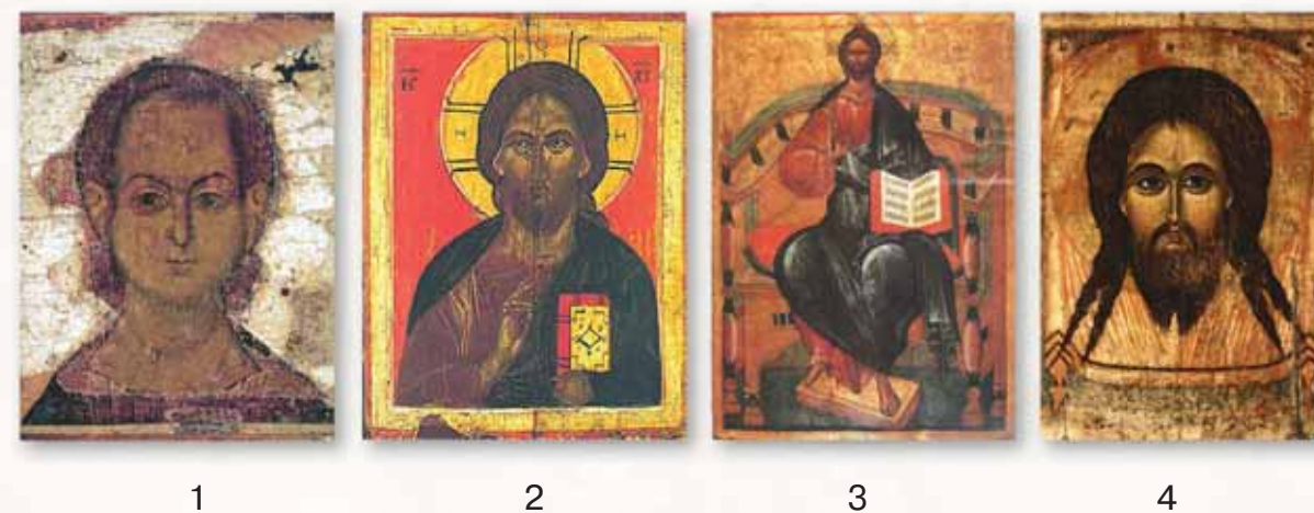
Рис. 4. Иконография Христа. 1 — Спас Эммануил. Икона XII в. (деталь); 2 — Господь Вседержитель. Новгородская икона XIV в.; 3 — Спас на Престоле. Икона XV в.; 4 — Нерукотворенный образ Спаса. Икона XIV в.

Спас Эммануил (имя означает «С нами Бог») — иконографический тип, представляющий Христа в отроческом возрасте (рис. 4, 1). Наименование образа связано с пророчеством Исайи «Сам Господь даст вам знамение: се, Дева во чреве приимет, и родит Сына, и нарекут имя Ему: Еммануил» (Ис. 7: 14), исполнившимся в Рождестве Христовом. Имя Эммануил присваивается любым изображениям Христа-отрока, как самостоятельным, так и в составе более сложных композиций. Отрок Христос всегда изображается отмеченным печатью духовной зрелости и, как правило, со свитком в руках.