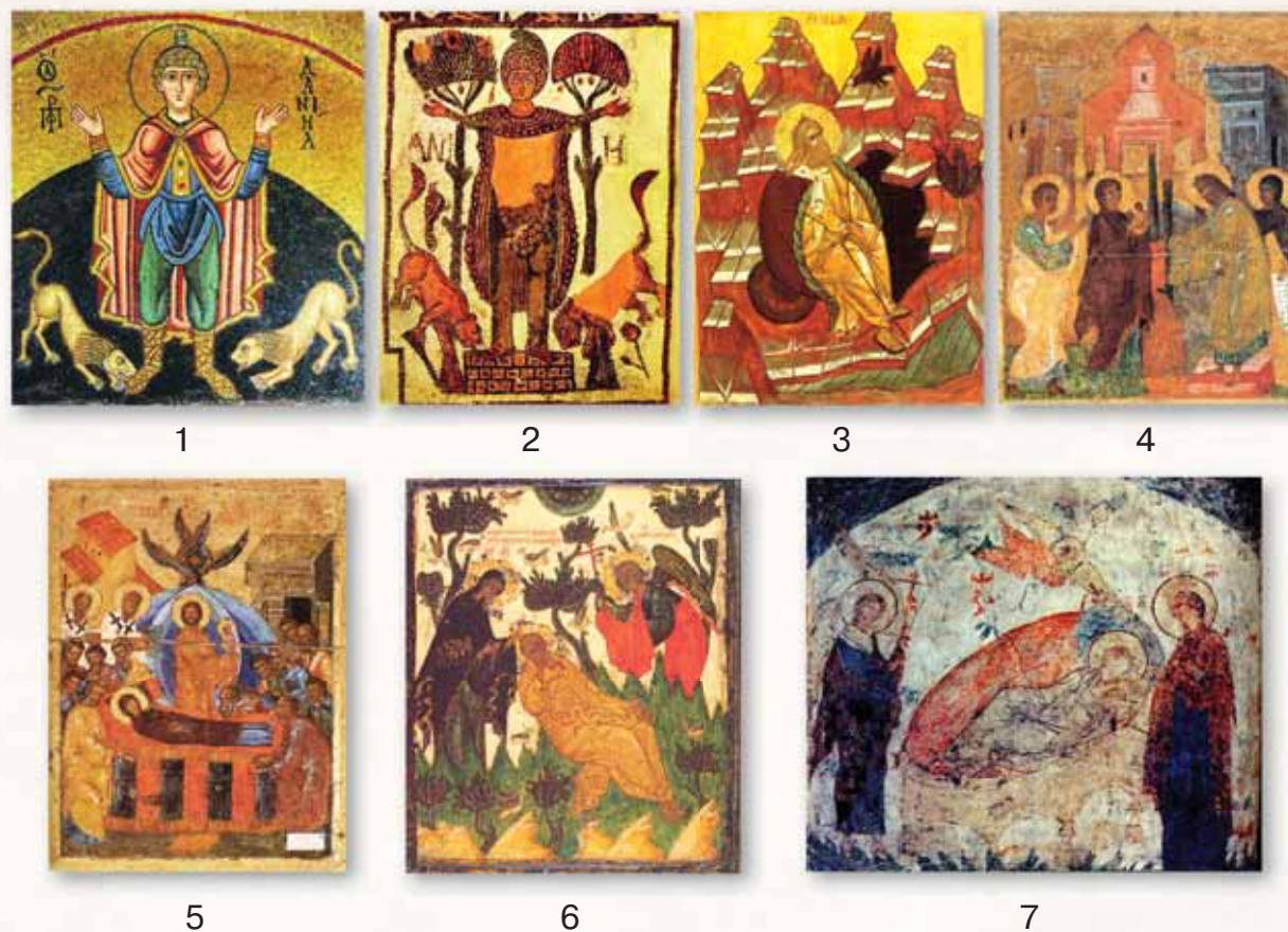
Рис. 10. 1 — Пророк Даниил во рву львином. Византийская мозаика 1030-х гг. в монастыре Осиос Лукас (Греция); 2 — Пророк Даниил во рву львином. Византийская мозаика V–VI вв.; 3 — Пророк Илия в пустыне. Икона XV в.; 4 — Сретение Господне. Новгородская икона XIV в.; 5 — Успение Пресвятой Богородицы. Новгородская икона XIV в.; 6 — Спас Недреманное Око. Русская икона середины XVI в. из собрания Музея икон Реклингхаузен (Германия); 7 — Спас Недреманное Око. Фреска XVII в. в Церкви Воскресения на Дебре (Кострома)

Новозаветные сюжеты на известных в настоящее время иконках-привесках ограничиваются изображениями двенадцатых праздников Сретения Господня и Успения Пресвятой Богородицы, а также композицией «Спас Недреманное Око», иллюстрирующей один из эпизодов земной жизни Христа и Богородицы.