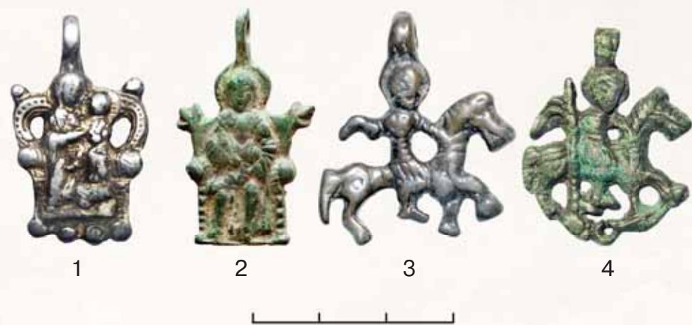
Рис. 15. Другие виды древнерусских амулетов-привесок в виде фигурок: 1, 2 – Богоматерь на Престоле; 3 – Святой воин; 4 – Чудо святого Георгия о змие (1, 2, 4 – domongol.ru; 3 – коллекция С.Н. Кутасова)

Судя по времени сложения изученных археологических комплексов, в которых были найдены подобные амулеты-привески, они бытовали на Руси и сопредельных территориях в XI–XII вв. Этому же времени соответствует и иконография изображений: архангелы на привесках чаще всего изображены в стихаре с епитрахилью и орарем, один конец которого накинута на левую руку, то есть в диаконском облачении, что символизирует их служение Господу, как диакон сослужит священнику, крылья имеют перистую разделку, руки разведены в стороны, мерло в правой руке архангела расположено вертикально и имеет высоту, равную его фигуре. Именно в этой иконографии, пришедшей из Византии, на древнерусских амулетах-змеевиках обычно изображался архангел Михаил (Николаева Т.В., Чернецов А.В., 1991, табл. I–IV). Кроме фигурок Небесных Сил бесплотных известны немногочисленные находки амулетов-привесок XI–XIII вв. в виде миниатюрных уплощенно-объемных композиций «Богоматерь на Престоле» (рис. 15, 1, 2), «Святой воин» (рис. 15, 3) и «Чудо святого Георгия о змие» (рис. 15, 4), происходящие преимущественно с исторической территории Киевской Руси. К настоящему времени опубликована лишь незначительная часть этих находок (Захаров С.Д., 2004, рис. 38; В.В. Нечитайло, 2001, № 571), а информация обо всех прочих крайне фрагментарна, что препятствовало их изучению и включению в публикуемый Каталог.